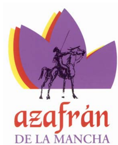
D.O.P. AZAFRÁN DE LA MANCHA