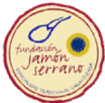
E.T.G. JAMÓN SERRANO