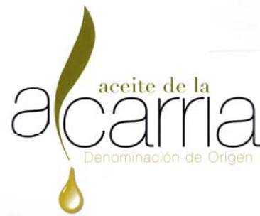
D.O.P. ACEITE DE LA ALCARRIA