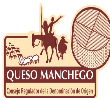
D.O.P. QUESO MANCHEGO