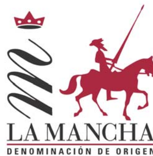
D.O. LA MANCHA