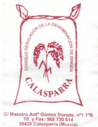
D.O.P. ARROZ DE CALASPARRA