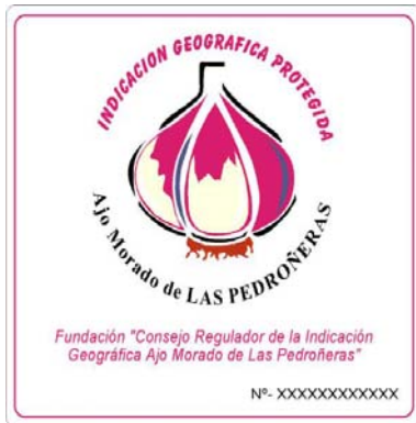
I.G.P. AJO MORADO DE LAS PEDROÑERAS