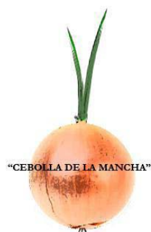
M.C. CEBOLLA DE LA MANCHA