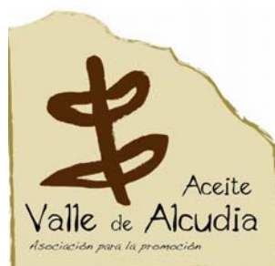
M.C. ACEITE VALLE DE ALCUDIA