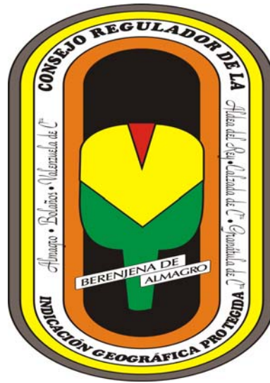
I.G.P. BERENJENA DE ALMAGRO