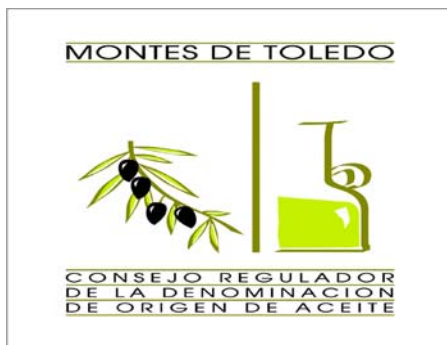
D.O.P. ACEITE DE LOS MONTES DE TOLEDO