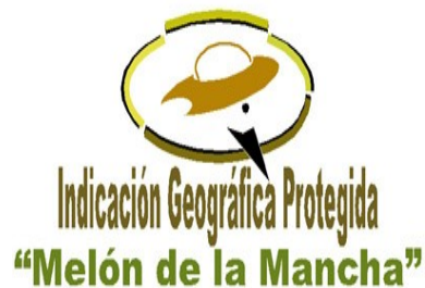
I.G.P. MELÓN DE LA MANCHA