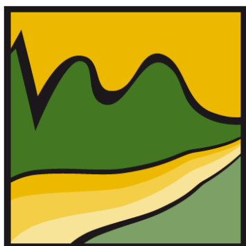
M.C. GRAFICA ACEITE SIERRA DE ALCARAZ