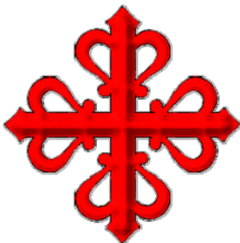
I.G.P. PAN DE CRUZ DE CIUDAD REAL