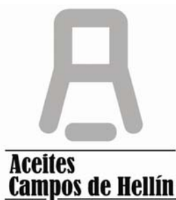
M.C. ACEITES CAMPOS DE HELLÍN